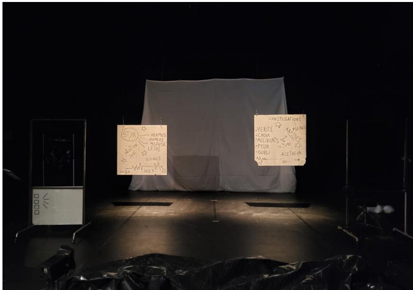
Tableau d'ouverture - Version 11 octobre 24

Ariane et Sophia, assises dans la salle au milieu du public, regardent sur le plateau, deux grandes cartographies remplies de mots, chiffres, pictogrammes.